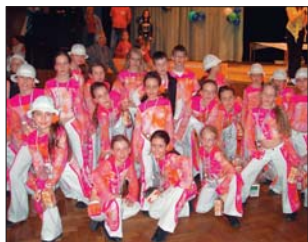
Taneční škola M-PLUS Olomouc se protancovala přes regionální kolo – Festival Olomouckého kraje z prvního místa na Mistrovství Moravy, které se konalo ve Vyškově. V dětské