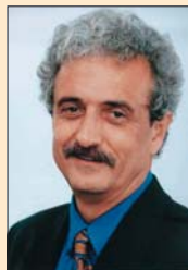
Pavel Dostál * 25. 2. 1943 Olomouc publicista, dramaturg, režisér, textař, dramatik, televizní scénárista, ministr Cena města Olomouce v oblasti dramatické umění